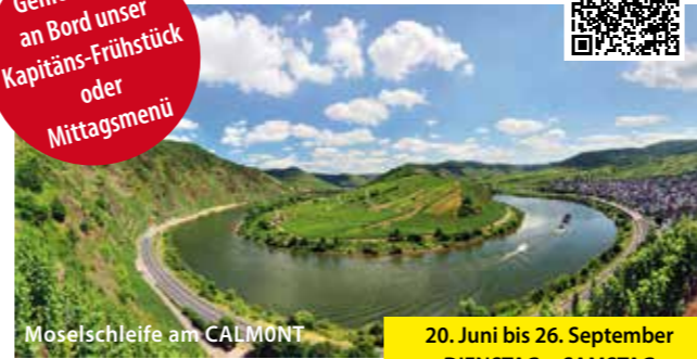
Moselschleife am CALMONT

Genießen Sie an Bord unser Kapitän's-Frühstück oder Mittagsmenü