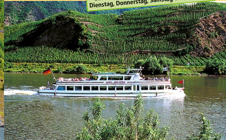
MS "Maria von Beilstein"

02. bis 09. Mai u. 21. Mai bis 24. Oktober Dienstag, Donnerstag, Samstag und Feiertage