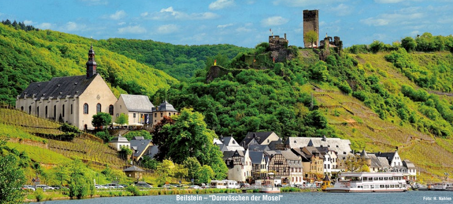
Beilstein – "Dornröschen der Mosel"