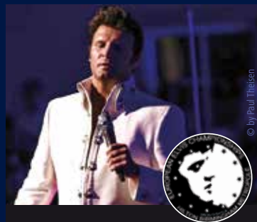
European Elvis & Gospel Champion 2015

Boarding: 19.30 Uhr Dinner & Show: 20.00 Uhr Ende: ca. 23.30 Uhr